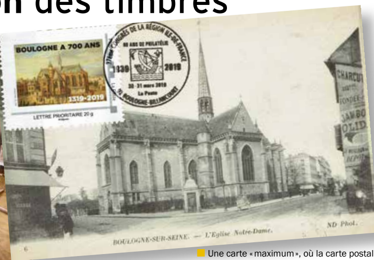
■ Une carte « maximum », où la carte postale et le timbre concordent. L'image date de 1911.